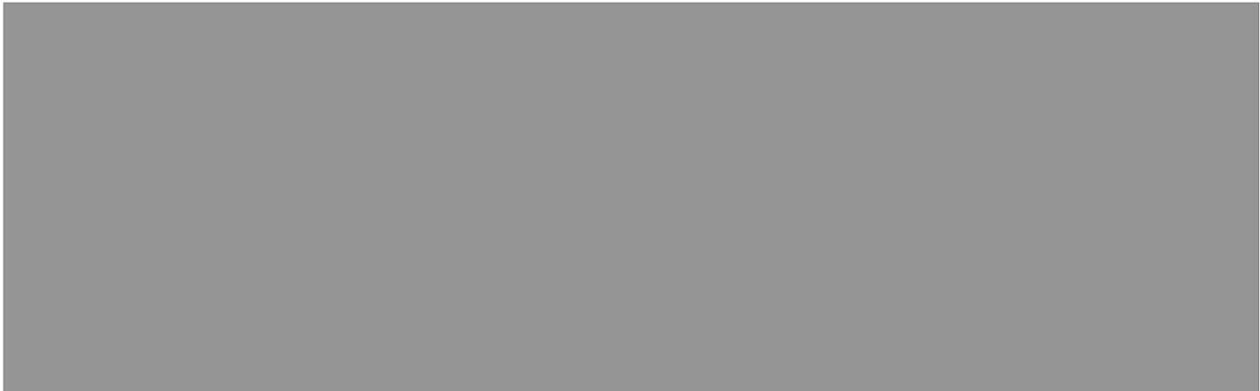
Figure 2 - Modes de scrutin par continent, 187 pays (1er octobre 2018) (publié p.61)